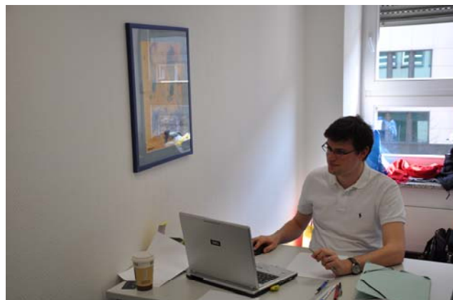
Study Room bei MBAhelp

Tip: Warten Sie nicht bis zum Ende Ihrer Vorbereitung, um sich zur Prüfung anzumelden. Melden Sie sich ca. 8 - 10 Wochen vor dem gewünschten Testtermin zur Prüfung an. So vermeiden Sie ggf. eine lange Wartezeit zwischen der Vorbereitungsphase und der Prüfung. Optimal ist eine genaue Abstimmung zwischen Ihrem Vorbereitungskurs und dem Prüfungstermin.